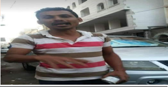
عدن.. الانتقالي يقتل مواطن بدم بارد أمام أسرته بكرير

ويتهم حقوقيون مسؤولي الإنتقالي في عمليات القتل والاعتقالات ومعظم الانتهاكات التي طالت المواطنين